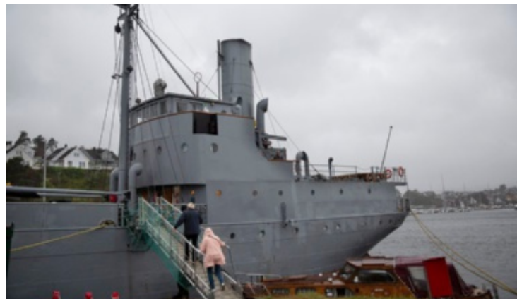
Publikum på vei ned under dekk.

Forestillingen er et samarbeid mellom Kanon Produksjon og D/S Hestmanden – Norsk krigsseiler-museum ved Vest-Agder-museet. Museets historikere har bidratt