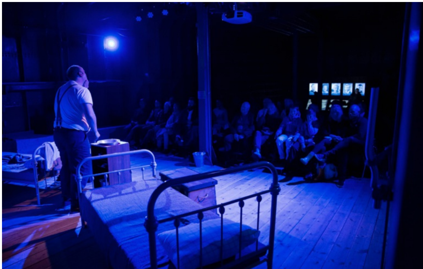
Lasterommet på Hestmanden er omgjort til teatersal for anledningen.

– Det er et ganske stort rom og et stort skip, samtidig er det lett å få en klaustrofobisk følelse når du er her i lang tid og kan få en torpedo